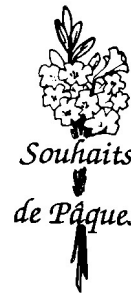
Souhaits de Pâques